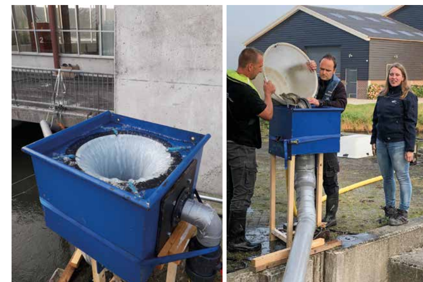
De speciale gebouwde vis invoerconstructie.

Gemaal Krimpenerwaard ligt aan de Lekdijk West in Bergambacht en vormt de verbinding tussen het waterlichaam Bergambacht en de rivier de Lek ten zuiden van het beheergebied. Het gemaal speelt een cruciale rol in de waterhuishouding van het achterliggende poldergebied. Omdat het volledige beheergebied van het waterschap onder zeeniveau ligt, is het gemaal onmisbaar om te voorkomen dat het gebied onder water komt te