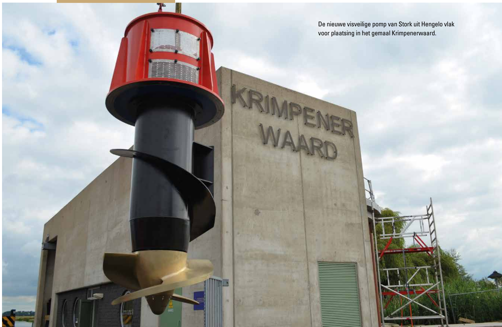
De nieuwe visveilige pomp van Stork uit Hengelo vlak voor plaatsing in het gemaal Krimpenerwaard.